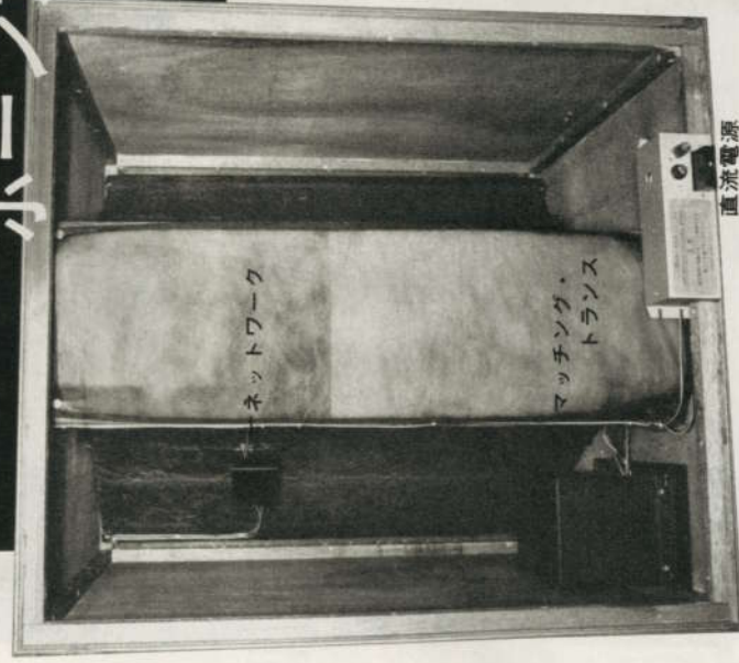
〈本機の裏面、ネットをとったところ〉

今回発表されたホーンSPシステムは、コンデンサ形SPを使用した珍しいもので、低域の70Hzから高域の18000Hzまでカバーしている。低音ホーンの材料としてベニヤ材が使用され、ホーンの音質を左右するデッドニングにはセメダインKKの#369というものを用いている。デッドニングはノドの部分で40mm厚、一番奥の部分で15mm厚ということである。